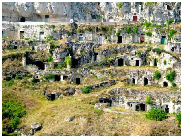
Grotte di MATERA