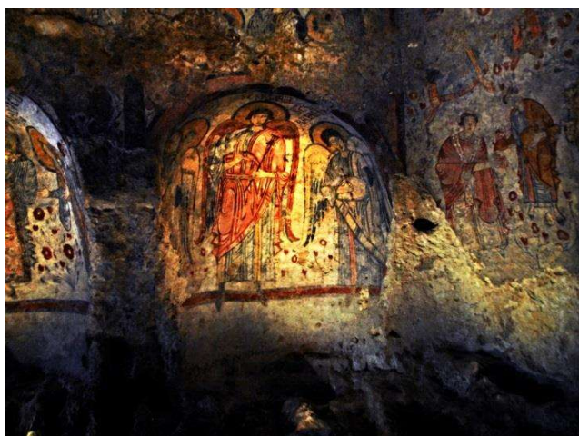
Cripta del peccato originale - MATERA