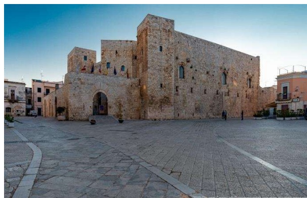
Castello Normanno Svevo - BARI