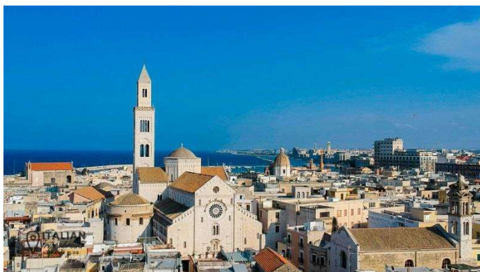
Basilica di San Nicola - BARI

Causale: Nominativo – Matera circolo dip. Bper